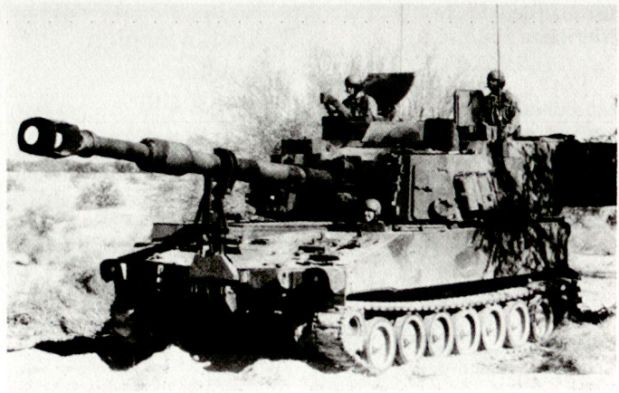
Version M-109A6 Paladin der US-Army.

kräfte sollen noch rund 4500 Panzerhaubitzen M-109 weltweit im Einsatz stehen. Die amerikanische Rüstungsindu-