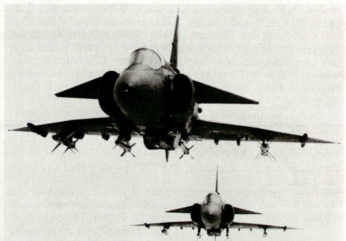
Abfangjäger JA-37 Viggen werden laufend dem neusten technischen Stand angepasst. Ab 2002 wird die Sollstärke der Flygvapnet noch aus 8 Viggen- und 8 Gripen-Staffeln bestehen.

den gelegenen Base von Satanas stationiert. Gleichzeitig werden die dort gegenwärtig noch vorhandenen zwei Geschwader Viggen aufgelöst oder auf einen anderen Stützpunkt verlegt. Das Gleiche ist für das Geschwader F13 von Norrköping vorgesehen, deren Abfangjäger JA-37 Viggen das Geschwader F17 von Ronneby verstärken, während die Aufklärer SF-37/SH-37 Viggen zum F10-Geschwader von Ängelholm stossen werden. Das Geschwader F6 von Karlsborg wird wiederum eine Staffel Viggen dem F15-Geschwader von Soderhamn abgeben, während die zwei übrigen Viggenstaffeln ausser Dienst gestellt werden. Bis zum Jahr 2002 wird Schwedens Luftwaffe noch