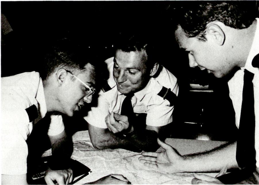
Diskussion über das Ergebnis einer Übung mit Landeskarten: Aspiranten der Stabssekretär-Offiziersschule während ihrer Ausbildung.

Sport und Pistolenausbildung haben im Ausbildungsplan ebenfalls einen hohen Stellenwert.