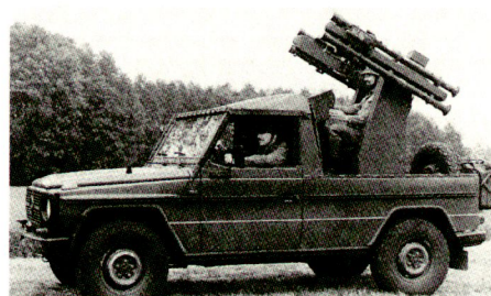
Aus Soldat und Technik 5/1993

soll die Krisenreaktionskräfte vor Angriffen aus der Luft schützen. Der Waffenträger, auf dem ein Abschussgestell für vier STINGER montiert sein wird, soll in einer CH-53 luftverladbar sein. Ob dafür besser ein Radfahrzeug oder ein Kettenfahrzeug geeignet erscheint, wird bis zur Billigung einer Taktisch-technischen Forderung (TTF) abschliessend bewertet. Je fünf Waffenträger bilden mit einer Aufklärungs- und Feuerleinheit einen autonomen Zug. Drei Züge werden in einer Batterie mit Verbindungstrupps