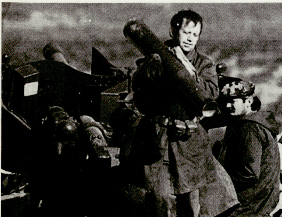
In Jugoslawien wird geschossen, hier sind Millionen auf der Flucht, hier droht jederzeit weiterhin die Eskalation zu internationalen Konflikten.

Aber auch in Mittel- und Osteuropa sind die jungen Demokratien noch alles andere als bereits gefestigt. Ich verweise auf das tragische Auseinanderbrechen der CSSR. Diese jungen Demokratien haben eine gute Chance. Wer Budapest, Prag und Warschau besucht,