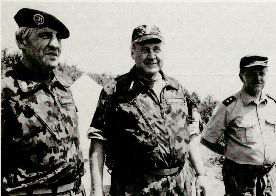
Ende Mai 1993 wurden zum zweitenmal in der Schweiz 36 Offiziere aus acht Nationen zu UNO-Militärbeobachtern ausgebildet. Mit den 16 Absolventen dieses Kurses verfügt unser Land nun über einen Pool von 65 ausgebildeten Militärbeobachtern. 30 davon standen oder stehen bereits im Einsatz. Der Generalstabschef Arthur Liener (unser Bild) auf Besuch an der Abschlussübung in Frauenfeld. Rechts auf dem Foto der finnische Kurskommandant Oberstleutnant Ikka Tiihonen und links der Waffenplatz-Kommandant Willy Hofmann.

● Während Kasachstan und Weissrussland es anscheinend ernst meinen mit ihrem Entschluss, auf Kernwaffen zu verzichten, so bestehen bezüglich der Ukraine berechnete und zunehmende Zweifel. Das ukrainische Parlament schiebt die Ratifikation von START immer wieder hinaus und verknüpft sie mit im-