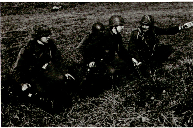
Die Ausbildung im Team hat erste Priorität.

Durch die Einführung von technischen Sicherungseinrichtungen und die Vergabe von Aufträgen zur Instandhaltung von militärischem Gerät an Private will man die Zahl jener Grundwehrdiener verringern.