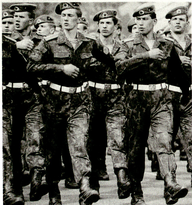
Die bisherigen Luftlandetruppen (5 Lla Div und ca. 8 selbständige Br) werden das Rückgrat der neuen russischen Mobilen Eingreifkräfte bilden.