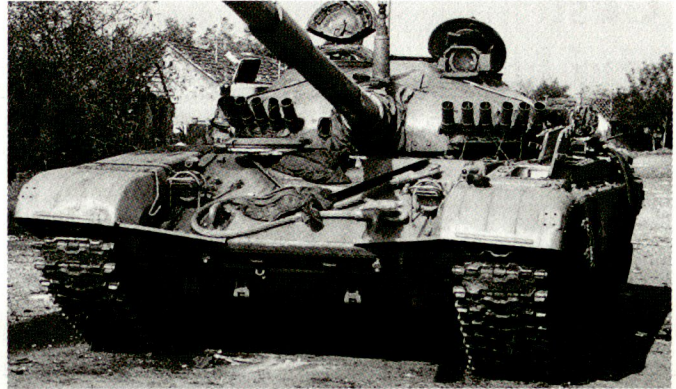
Serbien will angeblich die eigene Rüstungsindustrie wieder in Gang bringen. Vorgesehen ist auch die Wiederaufnahme der Panzerproduktion. (Bild: serbischer Panzer M-84).

Gemäss einer Meldung der Rüstungsbetriebe Krucik in Valjevo will sich nun Serbien auch auf die Entwicklung und