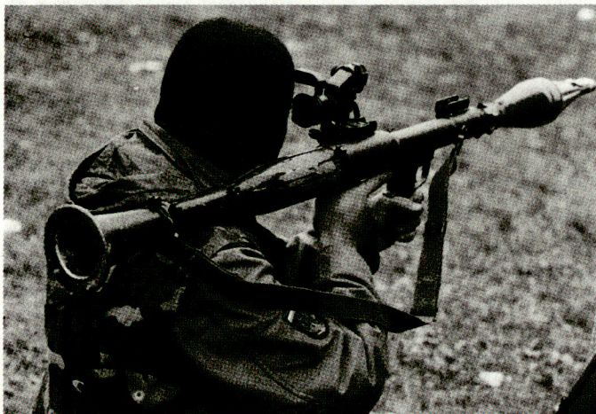
Die bewaffneten Kräfte im ehemaligen Jugoslawien werden vor allem aus Osteuropa mit Waffen versorgt.

Nicht zu überhören sind neuerdings Meldungen, die auf eine zunehmende technologische Unterstützung Serbiens durch Russland hinweisen. Wie weit in diesem Zusammenhang auch Waffenlieferungen eingeschlossen sind, lässt sich nur schwer verifizieren. Tatsache ist, dass sich in letzter Zeit diverse russische Militärführer sowie angeblich auch Rüstungsbetriebe für eine Unterstützung Serbiens stark gemacht haben. Zudem ist aus Medienberichten ersichtlich, dass auf serbischer Seite in Bosnien bereits mindestens zwei Einheiten von je 100 Mann kämpfen, die sich ausschliesslich aus Soldaten der ehemaligen Sowjetstreitkräfte zusammensetzen. Offensichtlich sind diese Spezialtruppen zur Hauptsache mit eigenen Waffen aus der GUS ausgerüstet. Seit einiger Zeit besteht eine sogenannte Bewegung zur Unterstützung der slawischen Völker, die vor allem in Russland Soldaten für den Kampf auf serbischer Seite anwirbt und sich angeblich auch für die Beschaffung von Kriegsgerät für Serbien stark macht. hg