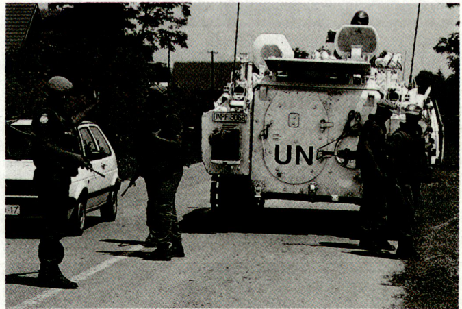
Eine allfällige Beteiligung der Bundeswehr an UN-Operationen erfordert Anpassungen bei der Truppeneinbildung.

Aber auch im Hinblick auf mögliche UN-Kampfeinsätze sind grundsätzliche Änderungen bei der Waffen- und Gefechtsausbildung notwendig. Im Gegensatz zu bisherigen militärischen Einsätzen, die der Erringung eines Sieges galten oder einen Abwehrerfolg zum Ziele hatten, muss jeder UNO-Auftrag dem obersten Ziel weltweiter Friedenserhaltung, bzw der Wiederherstellung des Friedens dienen. Es gilt also, die Soldaten auch in kritischen Situationen zu einem letztlich nur begrenzten Einsatz ihrer Waffen zu erziehen, um Blutvergiessen möglichst zu verhindern. hg