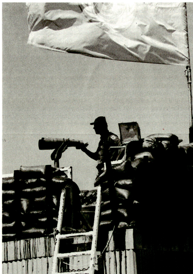
Die Ausbildung soll den neuen Einsatzerfordernissen und dem modernen Gefechtsbild angepasst werden.

Dass der entscheidende Ansatz nur über das Kader führen kann, haben mittlerweile alle Militärs begriffen. In erster Linie soll das Leistungsvermögen