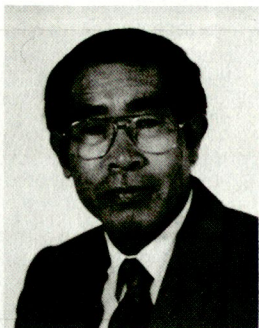
Ryoji Onodera; 1987 Sektionschef für Auswärtige Belange des Verteidigungsministeriums in Tokio; 1990 Ausserordentlicher und bevollmächtigter Botschafter in Syrien; 1992 Ausserordentlicher und bevollmächtigter Botschafter in Österreich.

Um das Interesse Japans an der sicherheitspolitischen Entwicklung in Europa zu verstehen, ist es notwendig, die Situation in Europa, am Atlantik und im Fernen Osten sowie am Pazifik miteinander zu vergleichen. Die Auflösung der Sowjetunion und des Warschauer Paktes hat auch in der sicherheitspolitischen Situation im Fernen Osten grundsätzliche Änderungen mit sich gebracht.