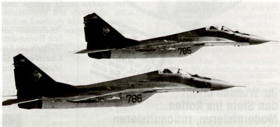
MiG-29 Fulcrum, der heute in kleiner Anzahl bei den meisten Oststaaten im Einsatz steht.