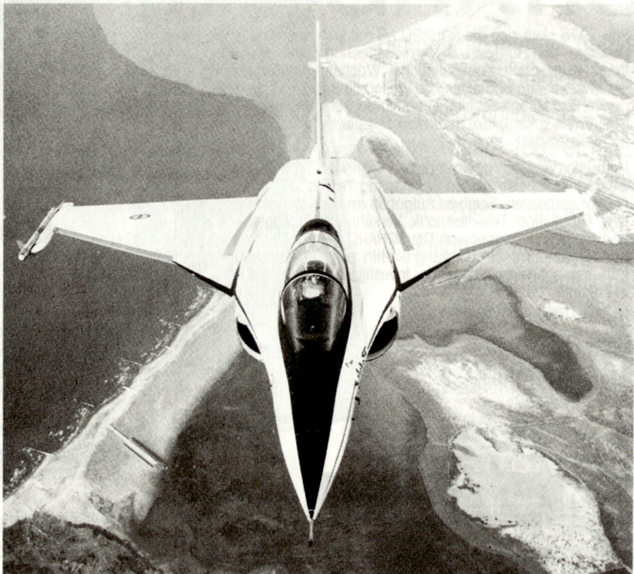
Europa entwickelt derzeit neue Kampfflugzeuge der sogenannten vierten Generation: EFA (Jäger 90), Jas-39 Gripen und Rafale (siehe Abbildung).