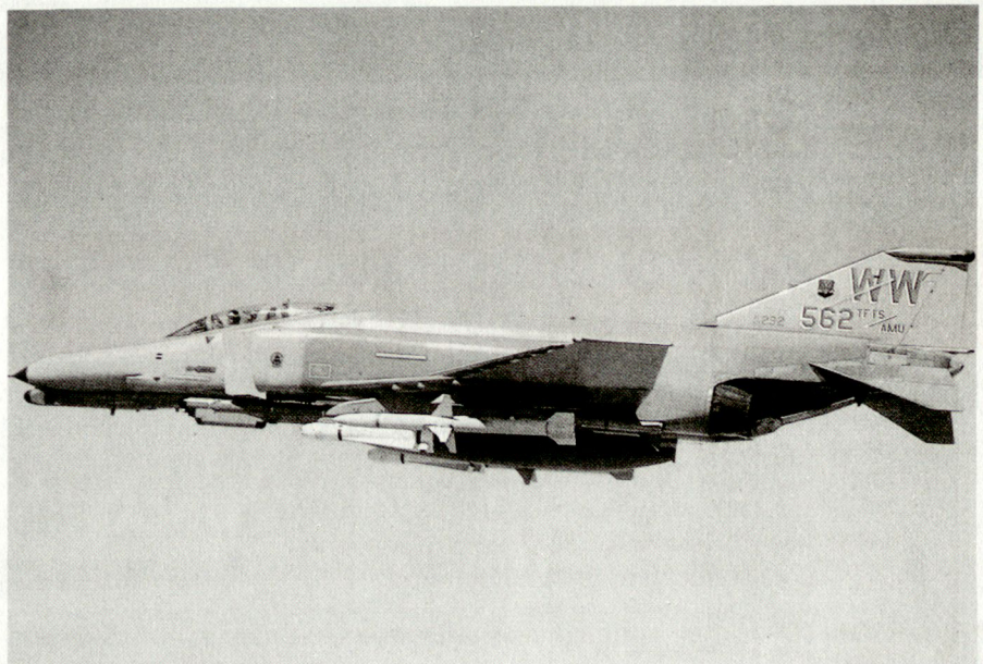
EKF-Flugzeug F-4G «Wild Weasel», ausgerüstet mit Antiradarlenk Waffen.

48 Jahre vor dem Angriff der alliierten Luftwaffe auf Irak spielte sich ein anderes Drama ab, das die Ära des elektronischen Krieges einleitete: In der Nacht vom 24./25. Juli 1943 verwendete die RAF bei einem Bombenangriff gegen Hamburg erstmals elektronische Mittel. Zwar hatten sie schon einmal versucht, die verheerenden Erfolge der deutschen Radars und