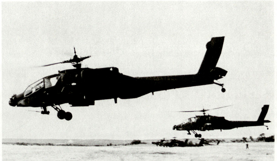
Kampfhelikopter AH-64 «Apache» der US Army.

Der Erfolg der Apache war durchschlagend, alle 27 abgefeuerten Hellfire hatten ihre Ziele getroffen, 100 2,75-Zoll-Raketen und 4000 Kanonenschüsse 30 mm hatten die Operation unterstützt, die nur wenige Minuten dauerte.