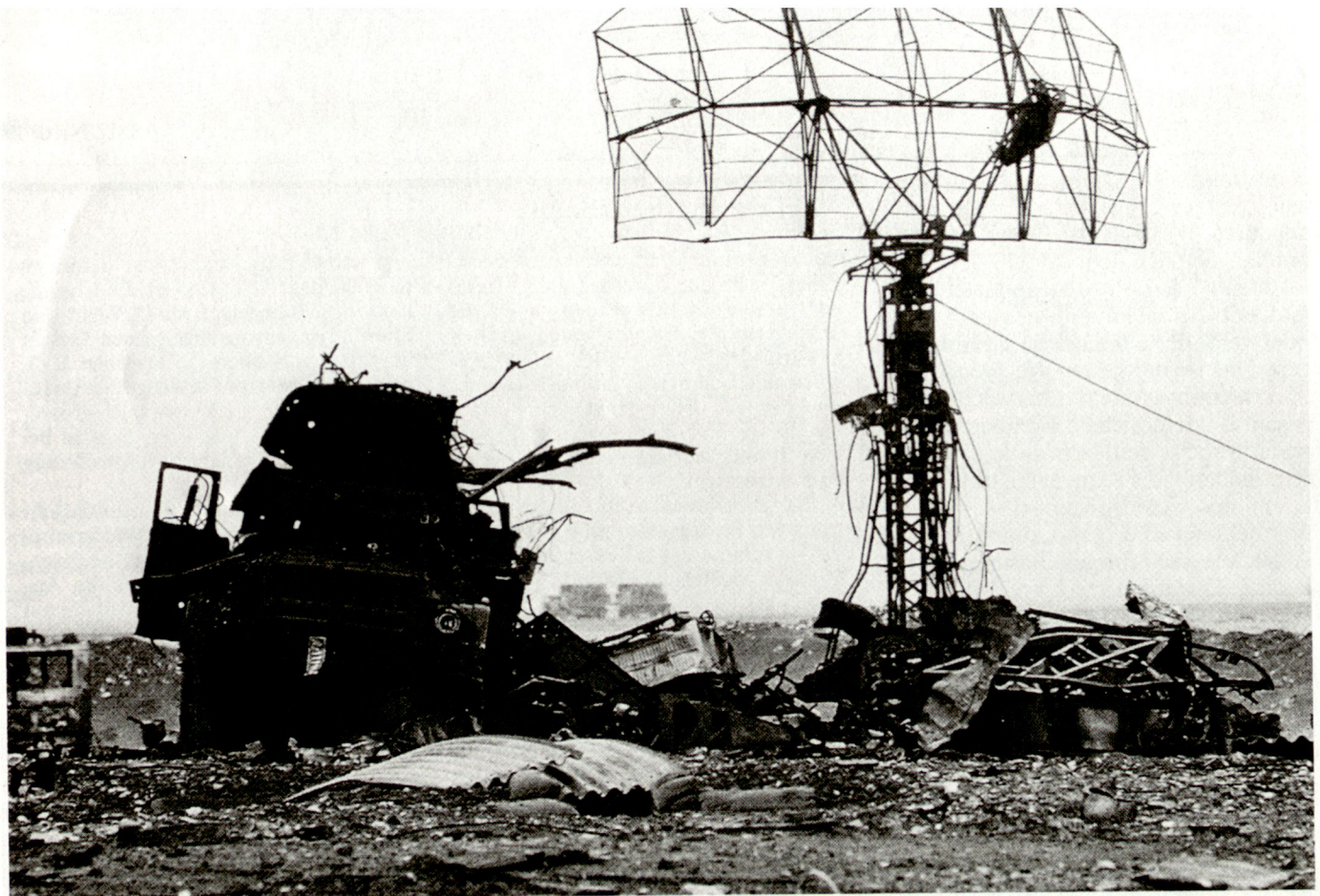
Zerstörte irakische Radarstation.

ihrer Jäger durch den Einsatz von Silberstreifen, sog. Düppeln, zu kontern, welche zusätzliche verwirrende Radarechos hervorriefen. Eine bereits 1941 von den Deutschen angewandte Methode, welche wegen der Möglichkeit der Störung eigener Radars lange umstritten war. Die hohen Verluste zwangen aber die RAF-Führung zum überraschenden Grosseinsatz des «window» genannten Düppelverfahrens. Der Erfolg gegen die deutschen Boden- und Cockpit-Radars war durchschlagend.