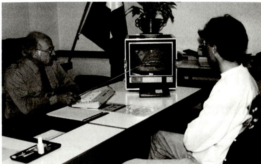
Zuteilungsgespräch mit modernstem Medienmittel.

Es liegt auf der Hand, dass bei niedrigen oder geringeren Anforderungen an die physische Leistungsmöglichkeit die berufsbezogenen Fähigkeiten stark in den Vordergrund treten.