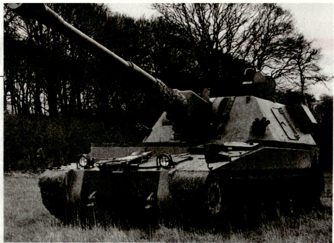
Prototyp der neuen britischen Panzerhaubitze 155 mm AS90, deren Auslieferung an die Royal Artillery kürzlich begonnen hat.

Diese B27-Studie kam zum Schluss, dass eine optimale Auflockerung sowie ausreichende Tarnung und Mobilität notwendige Voraussetzungen zur Gewährleistung der eigenen Konterbatteriefähigkeit bilden. Diese Erkenntnisse waren die Grundlage für das