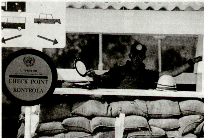
Belgischer UNO-Soldat in Kroatien. Trotz Reduktion der Streitkräfte soll das belgische Engagement für friedenserhaltende Missionen weiter verstärkt werden.

Das von der belgischen Regierung beschlossene Reformvorhaben ist im Lande – insbesondere bei den Militärs – nicht ohne Kritik geblieben. Verschiedene Kreise, insbesondere Generalstabschef Charlier, stemmten sich vehement gegen die Abschaffung der Wehrpflicht und die einschneidenden Truppenreduzierungen. Man hatte sich bis zuletzt für einen Streitkräfteumfang von mindestens 60 000 Mann eingesetzt.