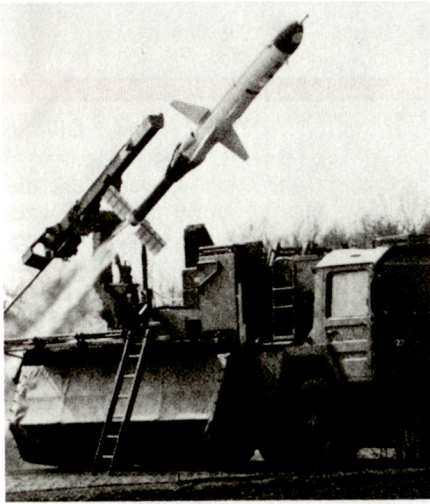
Das Drohnensystem CL-289 wurde auf der Basis der auch im Golfkrieg eingesetzten CL-89 entwickelt.