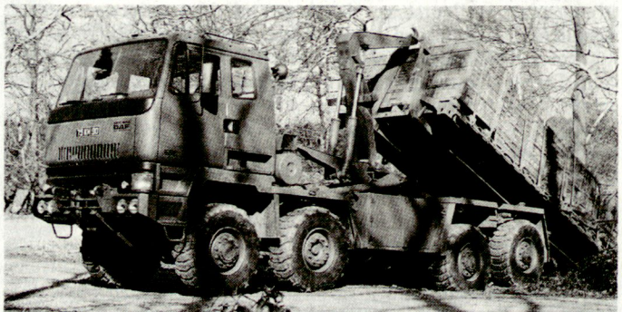
Wichtig ist die zeitgerechte Bereitstellung der Munition in der Nähe der vorgesehenen Stellungsräume. Angewandt wird das Munitionsversorgungssystem DROPS.

Das dritte wesentliche Element ist das Munitionsversorgungssystem DROPS (Demountable Rack Offloading and Pick-up System). DROPS ermöglicht die vorsorgliche und rechtzeitige Verteilung und Bereitstellung der Munition im ganzen Stellungsraum der Artillerie. Gegenwärtig läuft die Beschaffung einer grossen Zahl von Munitionstransportern (Geländelastwagen Leyland). Die Munition wird auf so-