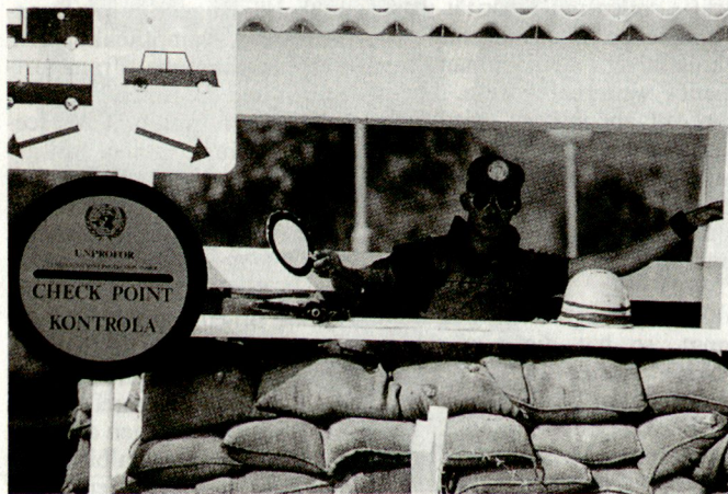
Belgischer UNO-Soldat in Kroatien. Trotz Reduktion der Streitkräfte soll das belgische Engagement für friedenserhaltende Missionen weiter verstärkt werden.

Das von der belgischen Regierung beschlossene Reformvorhaben ist im Lande – insbesondere bei den Militärs – nicht ohne Kritik geblieben. Verschiedene Kreise, insbesondere Generalstabschef Charlier, stellten sich vehement gegen die Abschaffung der Wehrpflicht und die einschneidenden Truppenreduzierungen. Man hatte sich bis zuletzt für einen Streitkräfteumfang von mindestens 60 000 Mann eingesetzt.