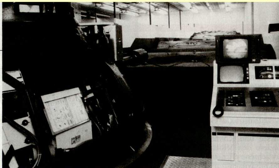
Schiess-Simulator ELSAP für «Panzer 68» auf dem Waffenplatz Thun

Ein- und mehrtägige Führungsübungen geben den Führern Gelegen-