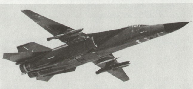
Jagdbomber F-111, der max 13 t Waffen mitführen kann.

Marschflugkörper der 3. Generation ist die hohe Treffgenauigkeit auch über Einsatzdistanzen bis 2500 km. Dies ist insbesondere auf die verwendeten TERCOM-Lenkverfahren zurückzuführen, (TERCOM = Terrain Contour Matching). Die in den Flugkörpern eingebauten Trägheitsnavigationsanlagen werden periodisch durch Geländekonturenvergleich aufdatiert. Die schiffgestützten, etwa 6,5 m langen Tomahawk-Lenk Waffen können mit konventionellen oder nuklearen