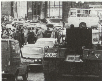
Wie das Beispiel Litauen zeigte, bleiben die Streitkräfte (im Bild Luftlandetruppen) das primäre Mittel zur Durchsetzung der zentralen sowjetischen Staatsgewalt.

Truppen», das sich bei diesem Ministerium befindet, gebildet.