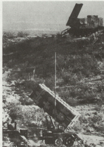
Raketenstellung MIM-104 Patriot, Werferstellung (vorne) und Multifunktionsradar (hinten).

Wie die Einsatzerfahrungen zeigen, liegen die Stärken von Marschflugkörpern bei deren Zielgenauigkeit, den flexiblen und relativ grossen Einsatzdistanzen und geringen Verwundbarkeit. Als eigentliche Schwäche der konventionellen