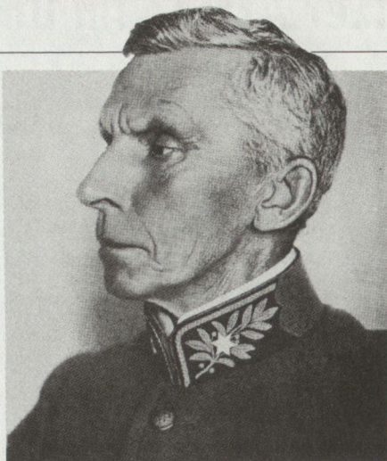
Oberstkorpskommandant Theophil Sprecher von Bernegg, der Schöpfer der TO 11, 1850–1927 1913–1919 Generalstabschef 1902–1909 Kdt 8. Div 1909–1912 Kdt 4. AK

Der Kampf um die Neugliederung des Heeres wurde sowohl in der Landesverteidigungskommission als auch in der Öffentlichkeit mit äusserster Heftigkeit geführt. Ulrich Wille und seine Anhänger kritisierten dabei vor allem die Schwerfälligkeit der neuen grossen Divisionen mit 3 Brigaden zu 2 Regimentern, welche mit ihren 22 000 bis 25 000 Mann als kleine Armeekorps besonders für Milizoffiziere fast nicht mehr führbar waren, sowie die ihrer Ansicht nach viel zu grosse Zahl der neugeschaffenen Gebirgstruppen. Überdies war der nachmalige General der Meinung, dass es angesichts der sehr schlechten aussenpolitischen Lage, der fehlenden Konsolidierung des Wehrgesetzes von 1907 sowie des mangelhaften Ausbildungsstandes von Truppe und Führern sehr gefährlich sei, noch all die Unruhe hineinzubringen, welche die Änderungen und Reformen der Truppen-gliederung während vieler Jahre nach sich ziehen würde 2 .