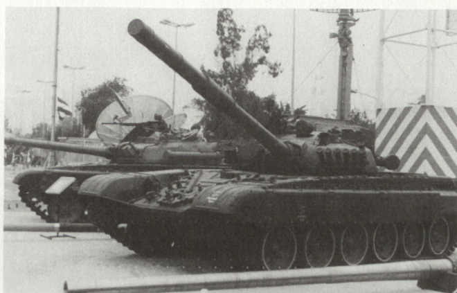
Modifizierte sowjetische Waffen für die IRQ-Streitkräfte. Links Schützenpanzer BMP-1, rechts Kampfpanzer T-72.

nierten, und ebensowenig hat die irakische Armee alle ihre ausgefeilten Waffensysteme überhaupt benutzt. Der grösste Teil des Kampfes wurde schlicht mit massivem Feuer geführt, und dabei wurde tagelang eine Unmenge Munition verschossen.