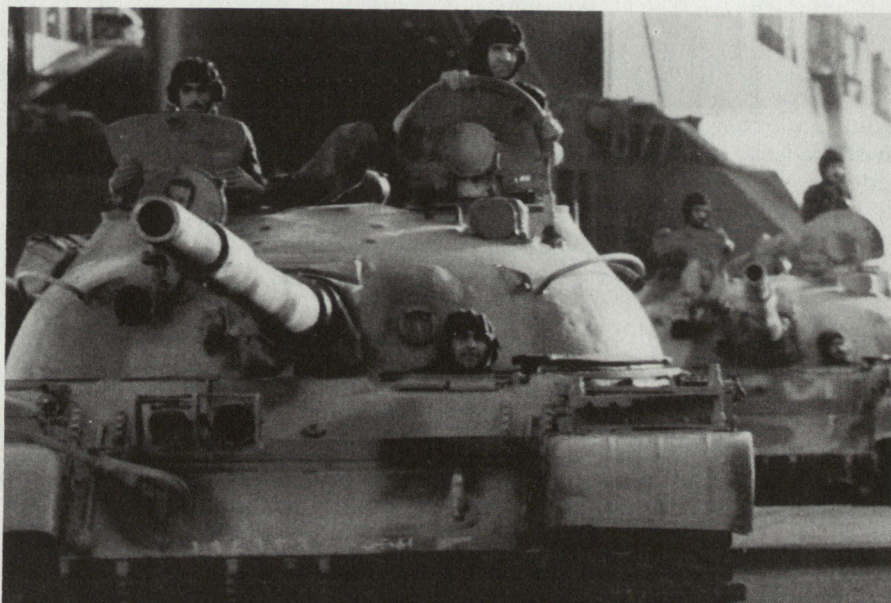
Syrische Panzer T-62

Wie in anderen arabischen Armeen fehlt es bei jungen und alten Offizieren an flexibler Führung. Dieser Hauptmangel ergibt sich aus dem politischen und geistigen Zwang und wird, solange das momentane System bestehen bleibt, nicht zu beheben sein.