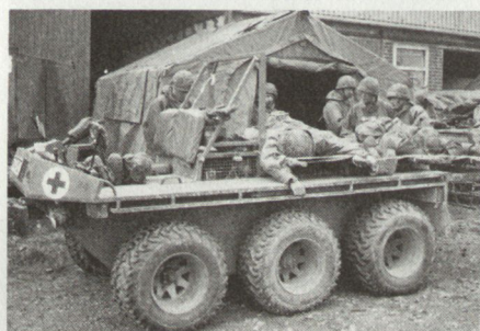
Geländefahrzeug Supercat (6×6) im San Bat der 24. luftmobilen britischen Brigade.

streckenraketen bestimmt waren, wird darin nicht erwähnt. Betrachtet man die einschlägigen Textstellen im Vertrag, so findet man die Forderung, dass der nukleare Gefechtskopf sowie die Leiteinrichtungen vor dem Eintreffen der Flugkörper in den Vernichtungsanlagen vom Flugkörper zu entfernen sind. In der Folge wird die Art und Weise der Zerstörung der eigentlichen Flugkörper genau umschrieben. Bezüglich der Gefechtsköpfe sind aber keine konkreten Absichten formuliert. Es liegt der Schluss nahe, dass beide Grossmächte an einer Weiterverwendung der Kernladungen interessiert sind. Zumindest war bei Vertragsabschluss beidseits kein konkreter Wille zur Beseitigung dieser Kernladungen vorhanden. Wie und zu welchen Zwecken die nuklearen Gefechtsköpfe einer neuen Verwendung zugeführt werden, darüber gibt es in beiden Staaten mehr oder weniger divergierende Aussagen. Offensichtlich steht aber heute auf beiden Seiten die Absicht im Vordergrund, die freiwerdenden Kernladungen für friedliche Zwecke einzusetzen. hg