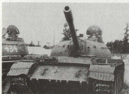
Abgezogene Kampfpanser T-55, die entweder verschrottet, für den zivilen Gebrauch umgebaut oder verkauft werden sollen.

Die Liste ist beeindruckend. Es sind die Krisenherde der militärischen und politischen Konflikte der Nachkriegszeit. Fast überall hatte also Moskau – in der Überzeugung, die westlichen Demokratien zu schwächen – seine Hand im Spiel. Und nicht nur auf politischen und ökonomischen Gebieten, sondern, wie die oben veröffentlichte Liste bezeugt, auch militärisch, meist mit Militärberatern, Ausbildungsspezialisten oder gar mit Sondereinheiten. P.G.