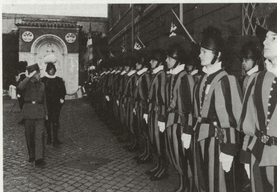
Oberst Buchs begleitet Korpskommandant Eugen Lüthy beim Abschreiten des Ehrenpiketts.