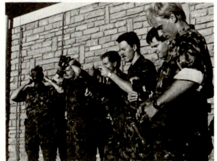
Abb. 1 und 2

Ausbildung. Dazu müssen ihre Vorge- setzten genügend Kenntnisse von den Vorgängen des Lernens haben, denn das Fehlen dieser Grundlagen wirkt sich viel nachteiliger aus als oft ange- nommen wird. Die besten Lernziel- formulierungen und Ausbildungsun- terlagen, die modernsten Geräte und Materialien – sie alle nützen nichts, wenn der eigentliche Lernprozess falsch organisiert wird.