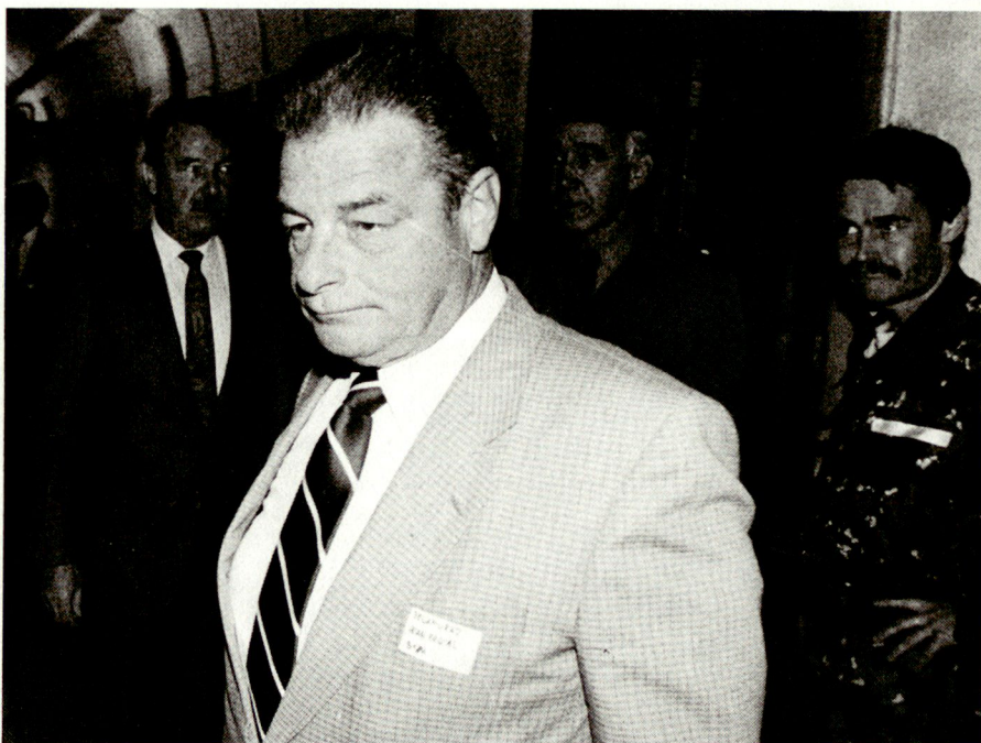
Intéressierter Besucher: Bundesrat J.P. Delamuraz

On peut donc mettre à profit l'expérience recueillie lors de cet exercice pour améliorer l'organisation de défense générale du canton afin d'assurer l'adéquation des moyens mis en œuvre aux diverses situations auxquelles elle pourrait être confrontée.