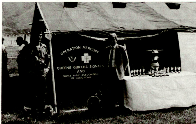
«Gabentisch» in Hongkong