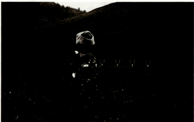
Pistolenschiessen auf Hongkong-Scheiben