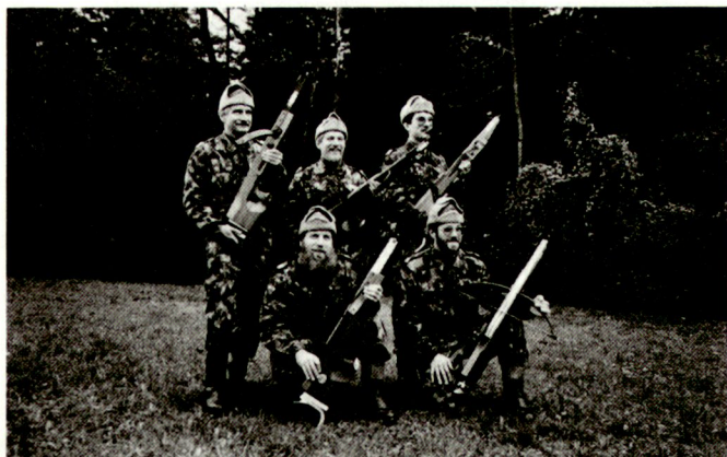
Die schweizerische Armbrustmannschaft

Ein «Apéro Suisse» im Armbruststand Oppligen sowie ein Mittagessen schlossen den gelungenen Anlass ab. ■