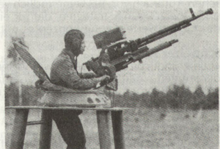
Richtübungsgerät Fliegerabwehr-Mg der NVA.

Panzerkommandanten können aber erst den Feuerbefehl erteilen, wenn die Identität des Heli bestimmt und die Anflugrichtung klar ist. Feuer soll nur auf Heli gerichtet werden, die den Panzer oder die Einheit direkt angreifen!