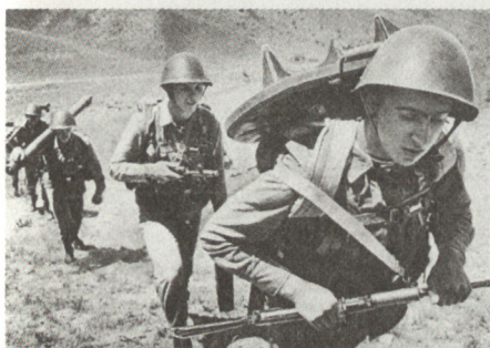
Einsatz von sowjetischen Minenwerfern im Gebirge.

Der Angriff der Mot Schützen erfolgt zu Fuss. Die vorhandenen Kampf- und Schützenpanzer sowie Flab-Panzer unterstützen diesen Angriff im Direktfeuer aus weiter zurückliegenden Feuerstellungen. Jeder der Mot Schützenzüge wird als selbständige Gruppe eingesetzt mit der Aufgabe, je eine der gegnerischen Verteidigungsanlagen einzuschliessen und zu vernichten. Nachdem die gegnerischen Anlagen durch die Mot Schützen eingeschlossen worden sind, treten die Pioniere in Aktion. Zwei Gruppen von Sprengspezialisten übernehmen das mitgeführte Sprengmaterial. Unter Ausnützung der vorhandenen Deckungen klettern sie den Hang hinauf, bis sie sich oberhalb der gegnerischen Stellungen befinden. Sämtliche Waffen geben ihnen dabei Feuerschutz. Ladungen von je etwa 50 kg Sprengstoff werden an Seilen auf die Verteidigungsanlagen hinabgelassen und gezündet. Auf die herausgesprengten Breschen richten Flammenwerfer ihr Feuer und unmittelbar danach brechen Mot Schützen in die gegnerischen Anlagen ein.