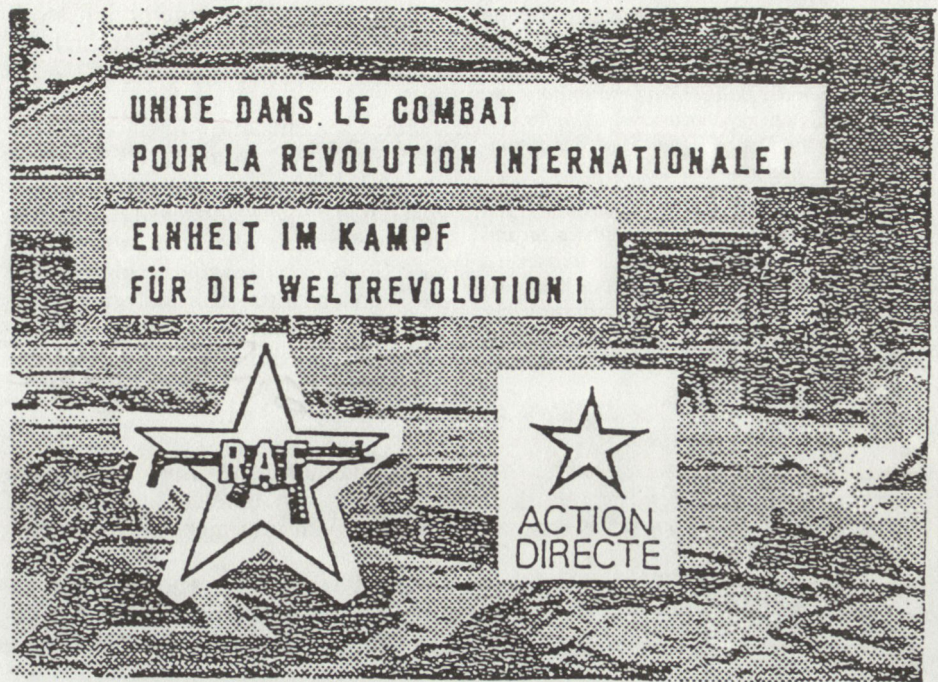
Abb. 2. Zeitschrift «Zusammen kämpfen», übliches Umschlagbild.

Nur einen Monat später, am 15. Dezember 1986, misslang der AD ein Sprengstoffattentat auf den früheren französischen Justizminister Alain Peyrefitte.