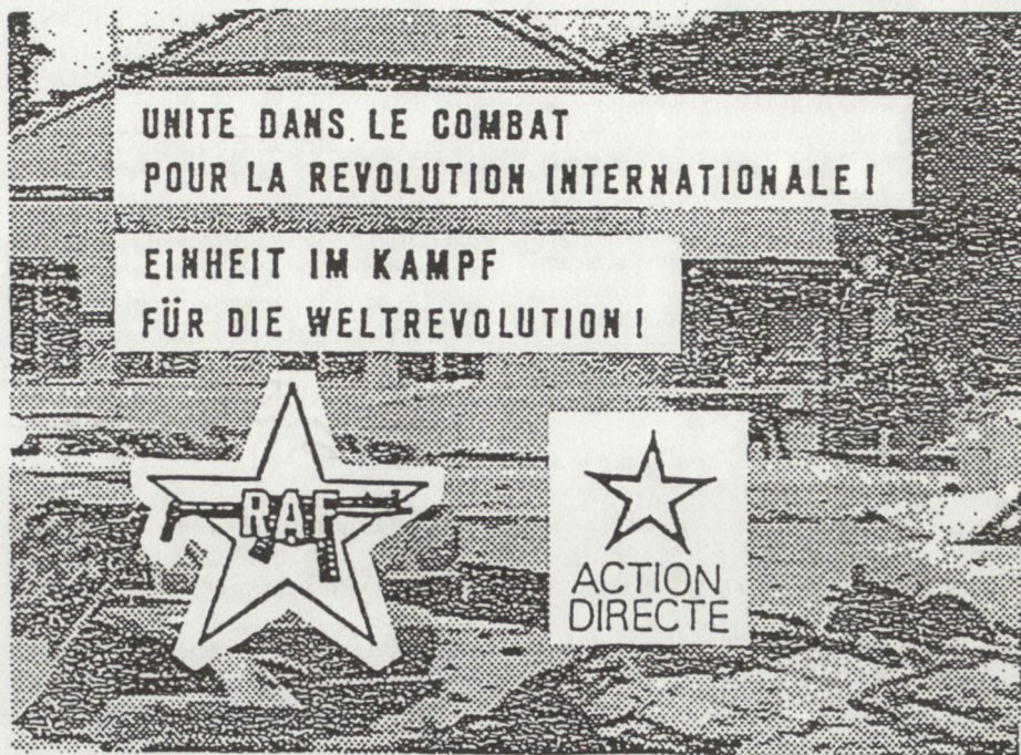
Abb. 2. Zeitschrift «Zusammen kämpfen», übliches Umschlagbild.

Nur einen Monat später, am 15. Dezember 1986, misslang der AD ein Sprengstoffattentat auf den früheren französischen Justizminister Alain Peyrefitte.