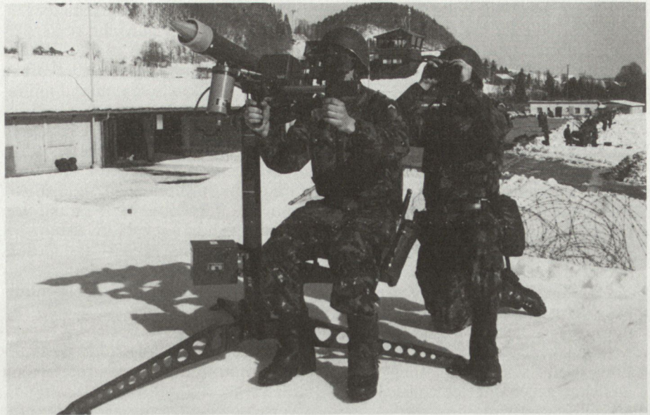
Leichte Fliegerabwehrenkaffe Mistral (Matra, Frankreich) bei der Truppenerprobung in der Schweiz