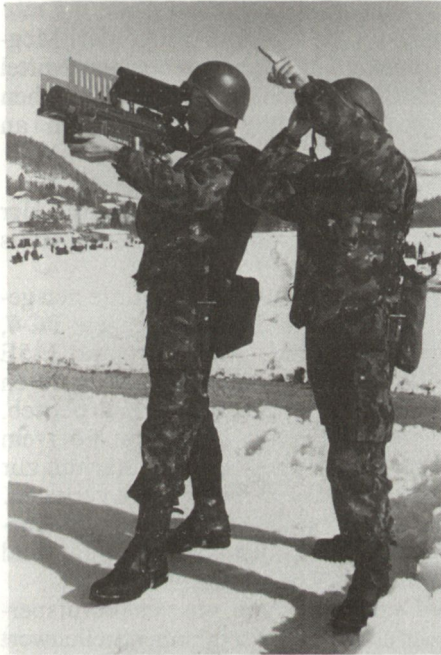
Leichte Fliegerabwehrenkaffe Stinger (General Dynamics, USA) bei der Truppenerprobung in der Schweiz