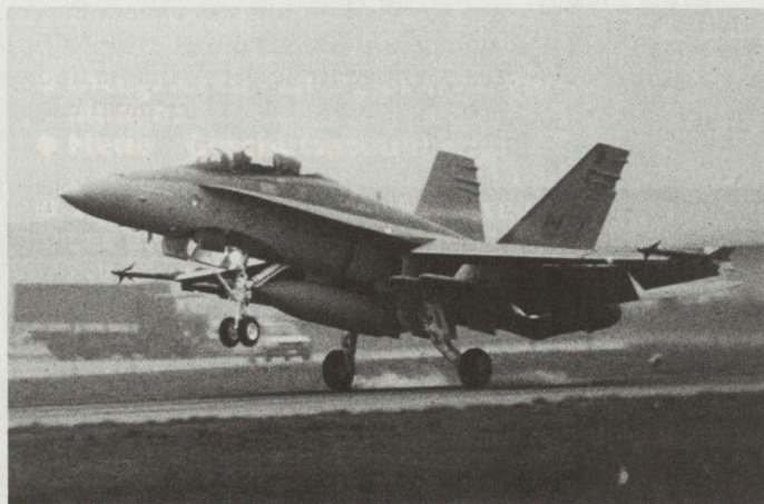
Kampfflugzeug F/A-18D (McDonnell Aircraft Co.) bei der Erprobung in der Schweiz