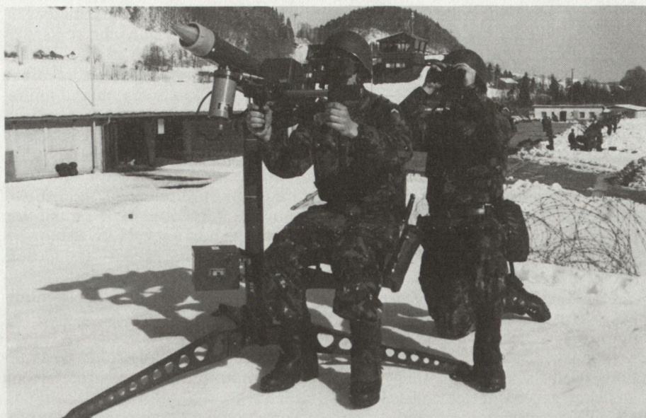
Leichte Fliegerabwehrkanone Mistral (Matra, Frankreich) bei der Truppenerprobung in der Schweiz