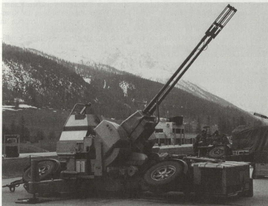
Kampfwertgesteigerte Fliegerabwehrkanone 35 mm (Waffenfabrik Oerlikon)

Die Flugwaffe hat auf dem Gefechtsfeld eine besondere Eignung für die Führung des Feuerkampfes auf operativer Stufe , das heisst zur Deckung der Bedürfnisse im Feuerkampf der Armeekorps. Ein Verband von Erdkampfflugzeugen weist eine enorme Feuerkraft auf, die in kurzer Zeit komplexe Ziele in grosser Distanz zerstören oder nachhaltig beschädigen kann. Wenn solche Ziele Führungseinrichtungen, Feuerbasen, Übersetzungsmittel,