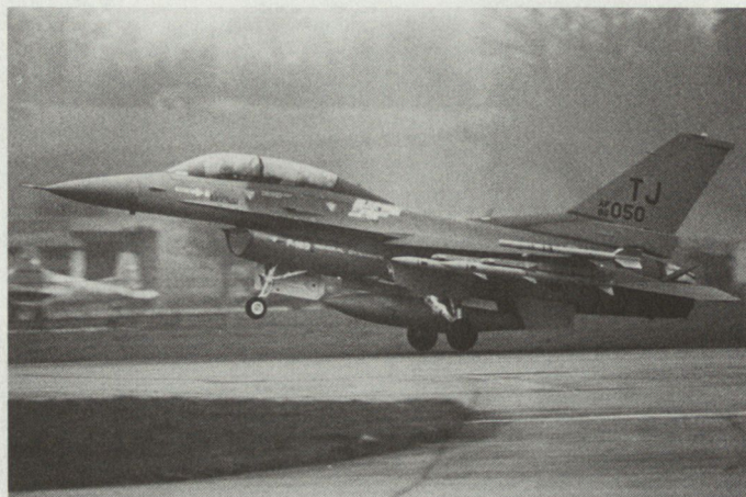
Kampfflugzeug F-16D (General Dynamics, USA) bei der Erprobung in der Schweiz