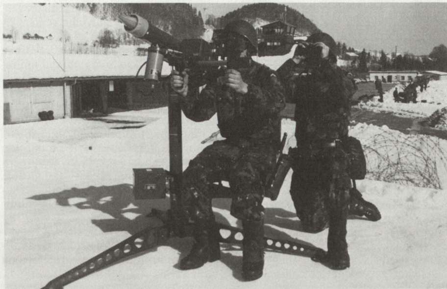
Leichte Fliegerabwehrenkwafe Mistral (Matra, Frankreich) bei der Truppenerprobung in der Schweiz