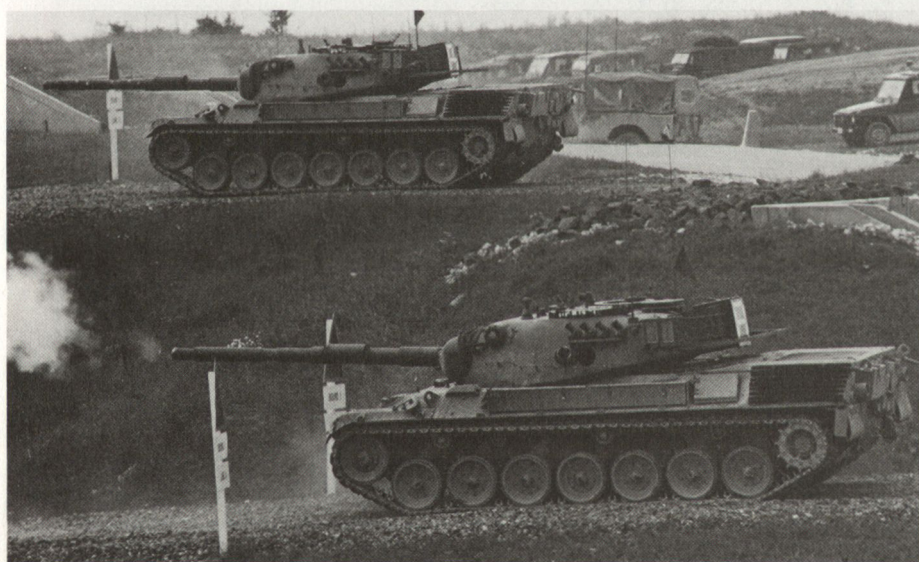
Abb. 3. Belgien (Leopard 1 SABC): Pz Kdt auf Tauchstation.

Die Wettkampfbestimmungen bei CAT wurden seit Beginn der Wettbewerbe im Jahre 1963 mehrmals geändert. Vielleicht führt diese kleine Nachlese dazu, dass bei CAT 89 der Feuerkampf mit geschlossenen Luken geführt wird... ■