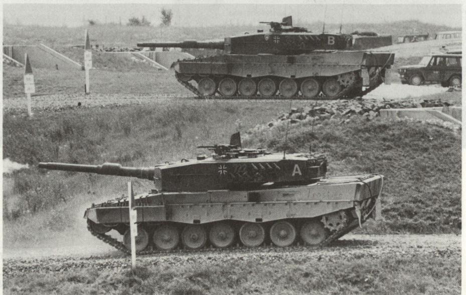
Abb. 2. BRD (Leopard 2): der Pz Kdt bleibt unten.