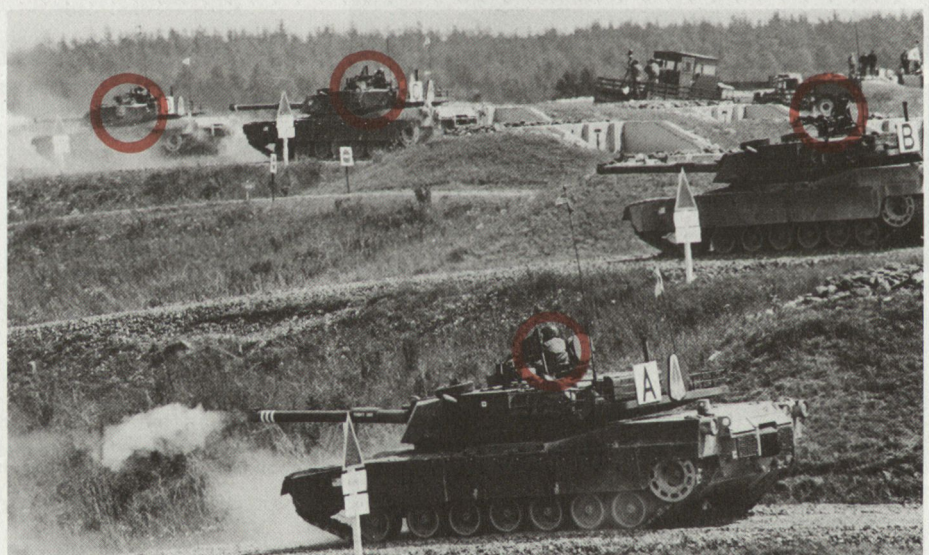
Abb. 1. USA (Abrams M1). Deutlich sichtbar: die Pz Kdt in der offenen Pz Luke.

Es ist erstaunlich, dass ein Vergleichsschiessen mit militärischen Geräten nicht auch militärisches Verhalten zur Grundlage der Regeln macht, nach denen der Vergleich abläuft. Der Panzer ist keine Sportwaffe und soll auch im Ernstfall Leistungen (Treffer) erbringen, und das mit geringsten Opfern. Ganz in diese Richtung geht mein neuer Vorschlag, beim Leopard 2 nachträglich noch eine Schnelleinweisvorrichtung rings um die Kdt-Luke anzubringen, denn Verkürzung der Reak-