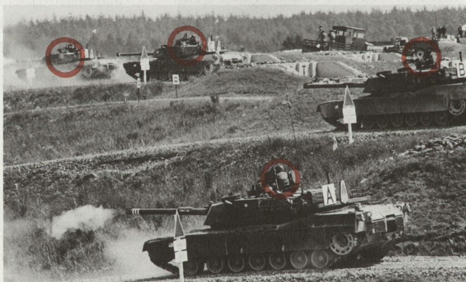
Abb. 1. USA (Abrams M1). Deutlich sichtbar: die Pz Kdt in der offenen Pz Luke.

Es ist erstaunlich, dass ein Vergleichsschiessen mit militärischen Geräten nicht auch militärisches Verhalten zur Grundlage der Regeln macht, nach denen der Vergleich abläuft. Der Panzer ist keine Sportwaffe und soll auch im Ernstfall Leistungen (Treffer) erbringen, und das mit geringsten Opfern. Ganz in diese Richtung geht mein neuer Vorschlag, beim Leopard 2 nachträglich noch eine Schnelleinweisvorrichtung rings um die Kdt-Luke anzubringen, denn Verkürzung der Reak-