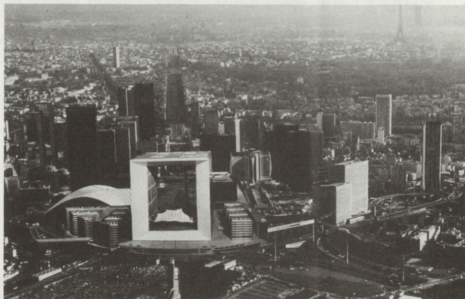
Bild 5. «La Défense» in Paris heute; in dieser Gegend stand die Kaserne von Courbevoie

Archives des Hauts de Seine, Nanterre. Banque de France, Direction Générale de la Caisse Générale, Paris. Bibliothèque historique de la Ville de Paris, Paris. Bibliothèque Nationale, Paris. Eidgenössische Militärbibliothek, Bern. Etablissement public pour l'aménagement de la défense, Courbevoie. Fondation pro Helvetia, Coppet. Les Maires et les Archives municipales d'Argenteuil, d'Asnières, de Bois-Colombes, de Bougival, de Clichy, de Courbevoie, de Gennevilliers, de Levallois-Perret, de Nanterre, de Neuilly-sur-Seine, de Puteaux, de Ruell-Malmaison, de Saint-Denis, de Suresnes et de Versailles. Ministère de la Culture, Conservateur régional des monuments historiques, Paris. Ministère de la Culture, Direction des Archives de France, Paris. Ministère de la Défense, Etat-major de l'Armée de Terre, Service historique, Vincennes. Monsieur le Comte H. de Bertier de Sauvigny, Paris. Musée de l'Armée, Hôtel national des Invalides, Paris. Musée de l'Île de France, Sceaux. Musée René Sordes, Suresnes. Schweizerische Kreditanstalt, Zürich. Schweizerische Landesbibliothek, Bern. Schweizerische Nationalbank, Bern. Time-Life International, Paris. Universités de Paris, Bibliothèque de Documentation internationale, Nanterre. Ville et Commune de Boudry, Etat civil – Police des habitants, Boudry. Zentralbibliothek Zürich, Zürich. ■