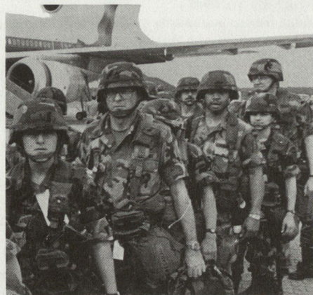
Landung amerikanischer Truppen in Deutschland anlässlich der strategischen Verlegeübung REFORGER 87.

REFORGER (Return of FORces to GERMANY) ist eine in der Regel jährlich stattfindende strategische Verlegeübung unter Beteiligung von Teilen des amerikanischen Heeres, der Marine und der Luftwaffe mit dem gemeinsamen Auftrag, Truppen von den USA nach Europa und zurück zu transportieren. Diese Verlegeübungen dienen zugleich der Glaubwürdigkeit der NATO-Abschreckung.