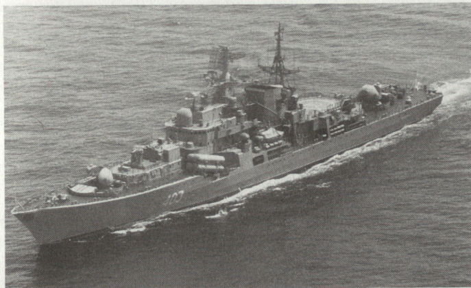
Die Rotbannerflotte schickt zunehmend auch moderne Einheiten, wie hier den Raketenzerstörer Otlichnyi der «Sovremennyi» -Klasse, zur 5. Eskadra ins Mittelmeer.

Diese Feststellung und jene der mangelnden logistischen Abstützung