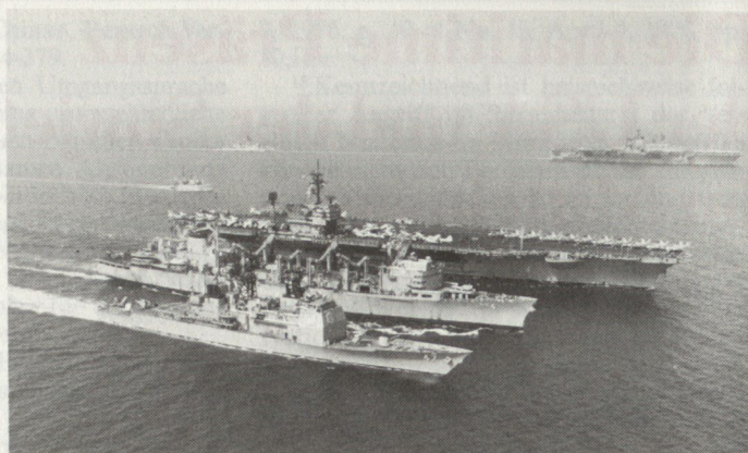
Kernstück der 6. US-Flotte sind die Trägerkampfgruppen, von denen eine bis zwei, in Krisenzeiten auch mehr, zum Verband gehören. Die Aufnahme zeigt den Flugzeugträger USS «John F. Kennedy», der zusammen mit dem hochmodernen Raketenkreuzer USS «Ticonderoga» (vorne) vom Versorgungsschiff USS «Detroit» im Mittelmeer Treibstoff, Munition und Lebensmittel übernimmt. Im Hintergrund der Flugzeugträger USS «Independence».

ungswege sicherzustellen hatte, neu definiert.