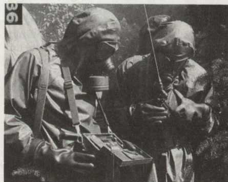
Das österreichische Bundesheer verfügt im Mobilmachungsfalle über total 1235 Spürtrupps.

Die ABC-Abwehrtruppe des österreichischen Bundesheeres ist eine unterstützende Waffengattung. Ihr Aufgabengebiet ist die Dekontamination und die grossräumige ABC-Erkundung sowie das Retten und Bergen und der Brandschutz vor allem in kontaminiertem Gelände.