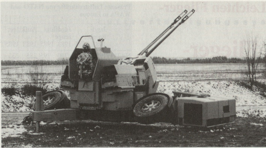
Abb. 1. Nachgerüstete 35-mm-Flab-Kanone mit Visier Gun King, Nachladeautomat, integrierter Stromversorgung und diversen Optimierungen an Steuerung und Kanone.