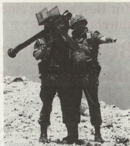
Abb. 2. Leichte (tragbare) Flab-Lenkwaffe vom Typ Stinger feuerbereit.

Die Leistungen eines tragbaren oder leichten Einmann-Flab-Lenkwaffensystems, beispielsweise «Stinger-Post», (Abb. 2, aus dem Schulterstand durch einen Mann abgeschossen, Kaliber von 70 mm, 15 Kilo schwer, Reichweite von 5000 Metern bei einer maximalen Wirkungshöhe von 3000 + Metern) wie auch SATCP (F) oder Blowpipe (GB), sind verführerisch . Solche Systeme stossen im Einsatz gerade im schweizerischen Gelände indessen rasch an praktische Grenzen . Eingehende Truppenversuche in taktisch relevanter Disposition in den Jahren 74 (RBS-70) und 82 (Stinger) bestätigen dies. Wir greifen