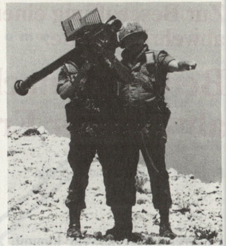
Abb. 2. Leichte (tragbare) Flab-Lenkwaaffe vom Typ Stinger feuerbereit.

1500 m) für den Selbst- und Objektschutz gegen Tiefflieger und Helikopter. Was verlangt nun das Bedrohungsbild zunächst von unseren bereits vorhandenen Flab-Mitteln?