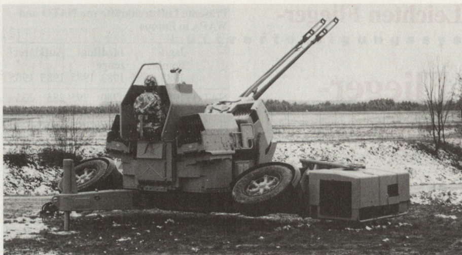
Abb. 1. Nachgerüstete 35-mm-Flab-Kanone mit Visier Gun King, Nachladeautomat, integrierter Stromversorgung und diversen Optimierungen an Steuerung und Kanone.

1500 m) für den Selbst- und Objektschutz gegen Tiefflieger und Helikopter. Was verlangt nun das Bedrohungsbild zunächst von unseren bereits vorhandenen Flab-Mitteln?