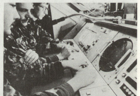
Das Kommandopult des Feuerleitgerätes SKYGUARD . Hier wird der Einsatz der 35-mm-Flab gesteuert.

mm-Flab-Kanone 54, die noch heute im Einsatz steht. Zur echt modernen Waffengattung wurde die Flab 1963 mit der Beschaffung der 35-mm-Kanone und des Feuerleitgerätes Superfledermaus. Weitere Meilensteine der Flab-Geschichte: Mitte der 60er Jahre wurde das Flab-Lenkwaffensystem BLOODHOUND fester und durch ständige Modernisierung bis heute wichtiger Bestandteil der Fliegerabwehr. 1970 bewilligten die eidgenössischen Räte die Beschaffung des moderneren, digital arbeitenden Allwetter-Feuerleitsystems SKYGUARD , welches für die Bekämpfung von Tieffliegern geeignet ist. 1984 schliesslich erfolgte die Einführung des Fliegerabwehr-Lenkwaffensystems RAPIER , welches vor allem für die Fliegerabwehr der mechanisierten Verbände eingesetzt wird.