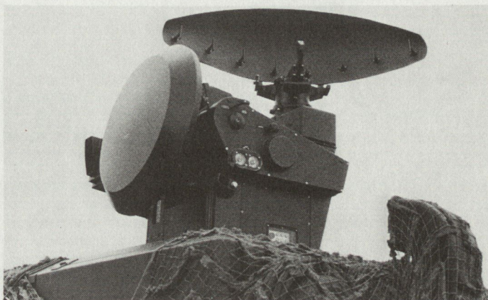
Der Suchradar des SKYGUARD (oben) liefert jede Sekunde eine Luftlagekarte im Umkreis von 15 km. Bei Auftauchen eines Gegners übernimmt der Folgeradar (unten) die Bekämpfung.