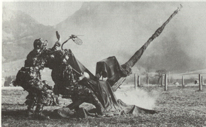
Die Flab-Kanone 54 mit ihrem 20-mm-Geschütz ist in mehreren hundert Exemplaren in unserer Armee zu finden. Sie kann auch gegen Helikopter bis auf eine Schussdistanz von 2000 m eingesetzt werden.

der Modernisierung einer HiFi-Anlage: Hat man gestern die Lautsprecher ersetzt, weil sie das schwächste Glied des Systems bildeten, so wird man heute wegen des inzwischen eingetretenen technischen Fortschritts den Plattenspieler gegen einen CD-Spieler austauschen, um mit vernünftigem Kostenaufwand à jour zu bleiben. Auf die Flab übertragen heisst das: Mit der Einführung des SKYGUARD Mitte der siebziger Jahre wurde die Feuerleitung des Mittelkaliber-Systems stark verbessert. Jetzt ist es an der Zeit, auch die 35-mm-Kanone aus dem Jahre 1963 zu modernisieren. Auf diese Art lässt sich der Kampfwert des 35-mm-Systems kostenwirksam an die geänderte Bedrohung aus der Luft anpassen. Dies ist um so wichtiger, als die Kanonen-Flab auch über die Jahrhundertwende hinaus eine notwendige Komponente unserer Luftverteidigung bleibt. ■