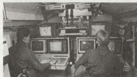
Prototyp-Version der C 2 U-Kabine als Bodenleitstelle für unbemannte Fluggeräte, links der «Pilot» und rechts der «Kampfbefehlshaber», der die von der Bordkamera gelieferten Videobilder überwacht.

Jede C 2 U-Kabine enthält eine von der Herstellerfirma als modulares Mehrzweck-Programmsystem bezeichnete Ausstattung mit Kartenbildgerät, Graphikgenerator, Maus, Sensorbildschirm, Tastatur, Drucker und Zeichengerät. Als Rechner wird für alle Teilsysteme die Kompaktversion des Mini-computers Micro Vax 2 der britischen Firma DEC verwendet. Die Programmierung erfolgt ausschliesslich in ADA. Die verwendeten Bildplattenspeicher VP 415 (Laser Vision) können je mehr als 54 000 Kartenbilder pro Seite speichern, wobei jede davon in weniger als einer Sekunde aufgerufen wer-