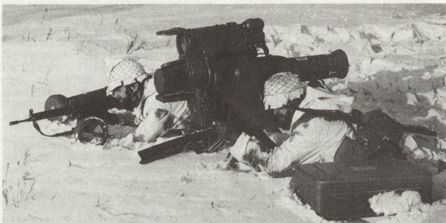
PAL MILAN mit aufgesetztem MIRA-Gerät

Mit diesem Wärmebildzusatz zum normalen Visier wird diese Waffe auch nachts ohne pyrotechnische Gefechtsfeldbeleuchtung einsetzbar. Ein Erkennen von Fahrzeugen soll bei normalen Verhältnissen bis über 2000 m eine Identifizierung bis etwa