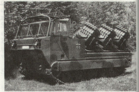
Durch das neue Minenwurfsystem SKORPION, das die Wurfminen AT-2 verlegt, können in kurzer Zeit grössere Minensperren verlegt werden.

Sperrmittel ist heute die Pioniertruppe der Bundeswehr in der Lage, flexibel und der aktuellen Lageentwicklung angepasst, die Panzerabwehr im Gefecht der verbundenen Waffen wirkungsvoll zu verstärken.