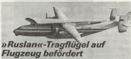
»Ruslan«-Tragflügel auf Flugzeug befördert

Das derzeit grösste Transportflugzeug der Welt, die sowjetische An-124 CONDOR (oder mit dem Originalcodenamen «Ruslan») steht seit einiger Zeit in der Serienfabrikation. Die An-124 stellte in den letzten Jahren eine Reihe von Rekorden auf, u. a. mit einem Transport von 150 t Fracht über eine Distanz von 4500 km.