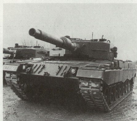
Der Leopard II: Zukunftsvision, die für die Mech Div 11 in den Jahren 1992/93 Realität werden soll.