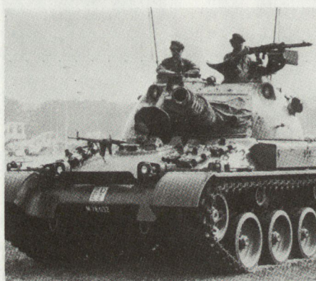
Der Panzer 68: Seit 1980 ist die Mech Div 11 einheitlich mit diesem Panzertyp ausgerüstet.