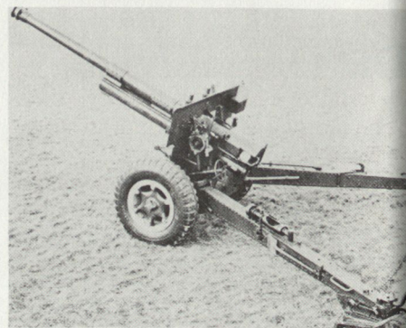
10,5 cm Schwere Kanone (CH)