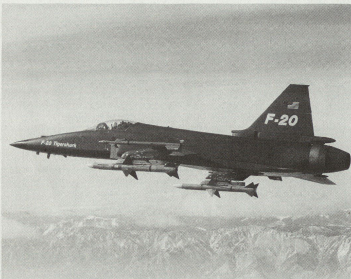
Die F-20 «Tigershark» in der Rolle eines Abfangjägers. Dieses leichte Jagdflugzeug kann sowohl radargesteuerte AIM-7-«Sparrow»- wie AIM-9-«Sidewinder»-Lenk Waffen mit Infrarot-Zielsuchkopf zum Abschuss bringen.