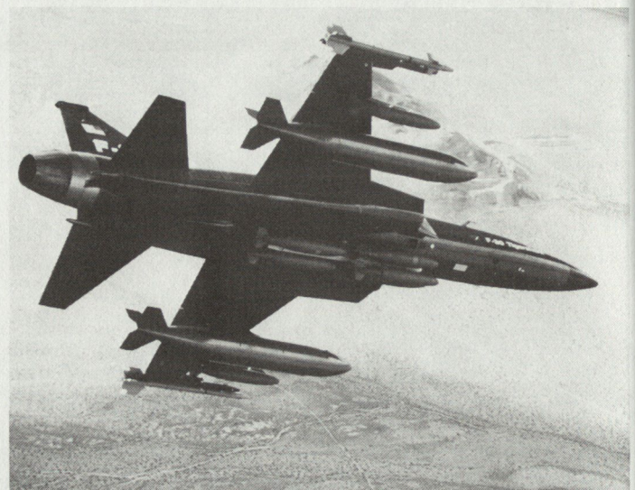
Beim Luft-Boden-Einsatz können insgesamt 7 MK-82-Bomben, zwei Sidewinder-Lenk Waffen und zwei abwerfbare Treibstofftanks mitgeführt werden.