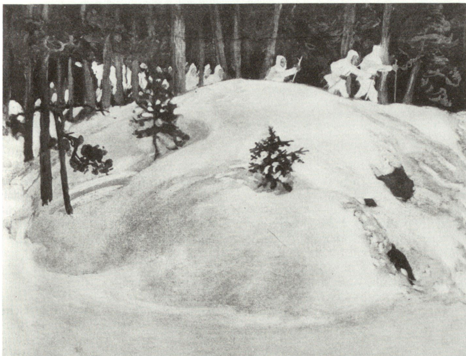
Akseli Gallen-Kallela: Februar-Vision, 1899 (Öl, Mannerheim-Museum, Helsinki).

Es war für Finnland wie für mehrere andere neue, selbständige Staaten günstig, dass die beiden Grossmächte an der Ostsee, Russland und Deutschland, nach dem Ersten Weltkrieg in einem geschwächten Zustand waren. Finnland fing somit an, insbesondere zu den