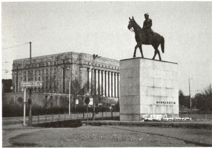
Mannerheim-Denkmal vor dem Parlamentsgebäude in Helsinki.