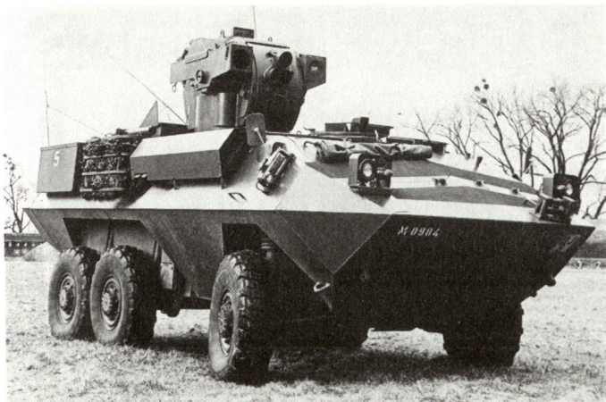
Lenkwaffen-Panzerjäger 85 (Turmvariante).

nigen Jahren in Serien fabriziert werden können. Auch die Frage einer Eigenentwicklung ist zur Zeit in Abklärung.