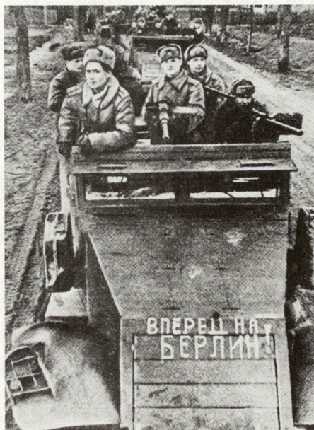
«Vorwärts nach Berlin!» Sowjetische Schützenpanzer unterwegs nach Berlin, März 1945.

Da zwischen dem SHAPE in Paris und der «Stawka» (Oberkommando der Roten Armee) in Moskau keine unmittelbare Verbindung bestand – weder die Russen noch die Westalliierten unterhielten Verbindungsstäbe in den Hauptquartieren –, stammten die militärischen Informationen der Roten Armee über die Operationen ihrer Kriegs-