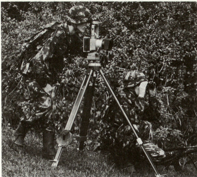
Einsatz einer Fotopatrouille im Mittelland mit Pano-Kamera APK 70 (Wild).