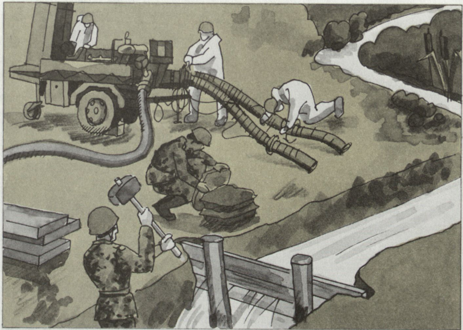
Erstellen von künstlichen Wasser- bezugsorten.