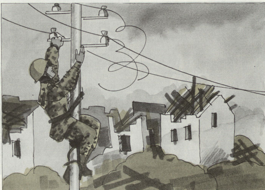
Behebung von Schäden an der Infrastruktur.