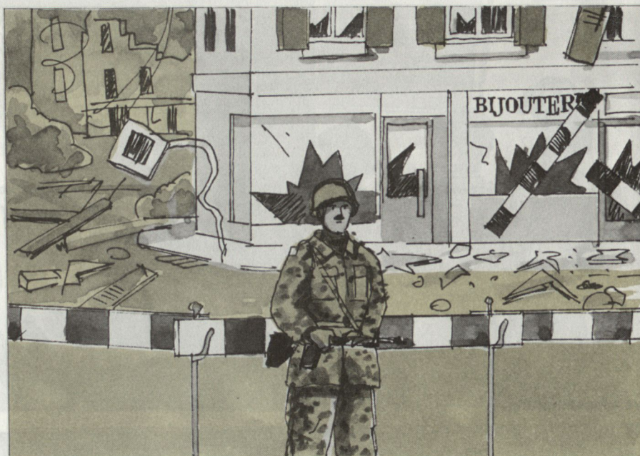
Absperren des Schadengebietes und Verhinderung von Plünderungen.