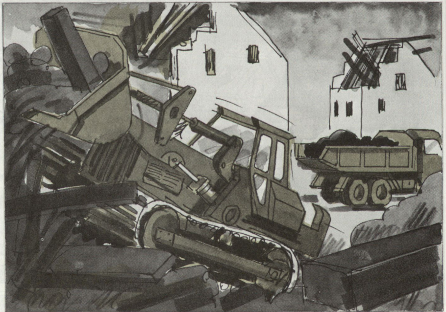
Räumung von Strassenzügen.