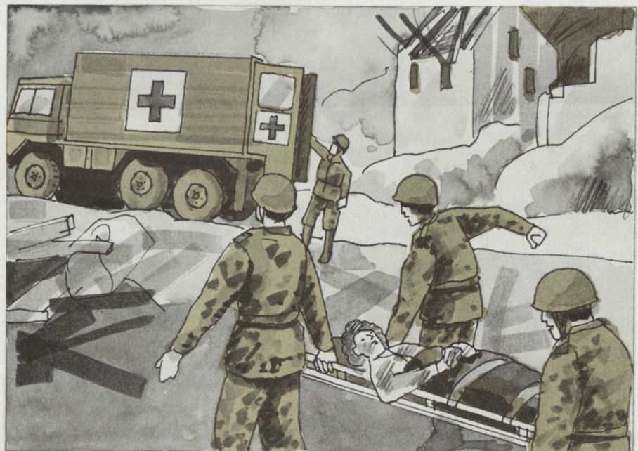
Versorgung und Abtransport von Verletzten.