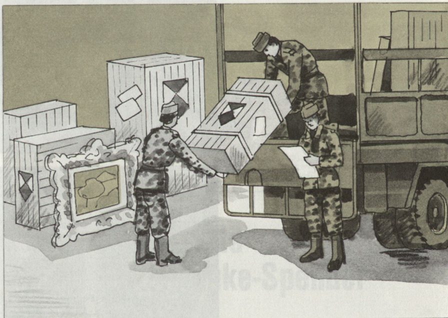
In schweren und ausgedehnten Schadenlagen (Nachangriffsphase)