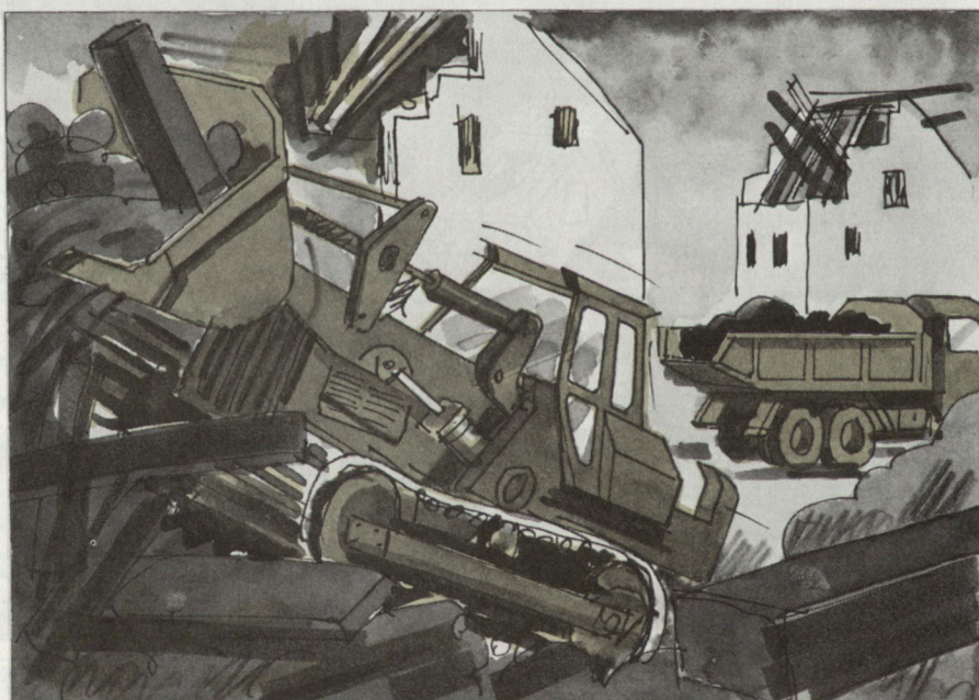
Räumung von Strassenzügen.