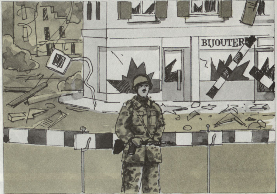
Absperren des Schadengebietes und Verhinderung von Plünderungen.