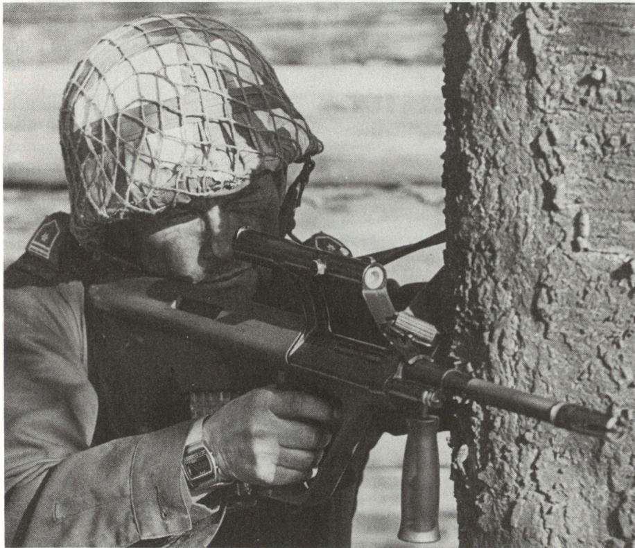
Das Sturmgewehr verfügt über eine mit der Waffe fest verbundene optische Zielvorrichtung.

Verfahren gesetzt. Die Theorien wurden im Hinblick auf ihre praktische Anwendbarkeit ausgetestet und erforderlichenfalls modifiziert. Die Entwicklung ist nunmehr so weit fortgeschritten, dass die Anlernphase durch eine Festigungsphase abgelöst werden kann.