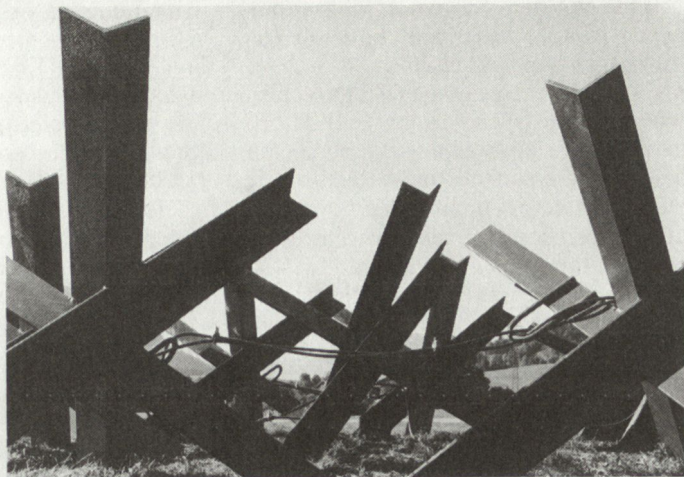
Panzersperren bilden das Rückgrat der Verteidigung von Schlüsselräumen zur Sperrung der entscheidenden Bewegungslinien.

Man überlegt sich daher, wo sind diese Durchmarschräume und wo sind die entscheidenden Räume an dieser Achse, und bildet hier Schlüsselzonen, die die Räume blockieren können.