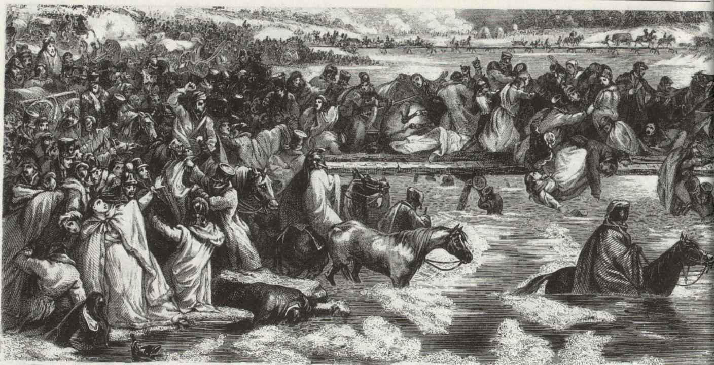
Bild 2. Der Übergang der Grossen Armee Napoleons über die Beresina (nach Saint-Hilaire, Band 2, Frontispiz).

zurückweisen, damit die Garde frei und ungehindert passieren könne. Sie erfüllten ihren Auftrag mit grossem Eifer und hieben aus Leibeskräften mit der flachen Klinge und ohne Ansehen der Personen und des Ranges auf alle, die vorwärtsdrängten und nicht zur Garde gehörten. Aber ihre Bemühungen wurden mit jedem Augenblick fruchtloser; unaufhörlich vermehrte sich das Gedränge, die verworrene Menschenmasse drückte mit wildem Geschrei gegen die Brücken, denn es galt hier sein Leben zu retten. Die Stärkeren überritten oder überschlugen die Schwächeren und brachen sich mit Gewalt eine Bahn; umsonst flehten die Kranken und Verwundeten um Erbarmen, das Mitleid und jedes menschliche Gefühl war in der Brust erstarben, und jeder dachte nur daran, seine eigene Haut in Sicherheit zu bringen.»