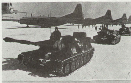
Luftlandepanzer ASU-85 (lufttransportfähig oder auf Spezialpalette mit Fallschirm abwerfbar) vor dem Verlad in An-12-Transportflugzeuge.

– Anzustreben ist deshalb der «totale Sieg» 7 . «Totaler Sieg» ist die logische Folge des Konzeptes des «totalen Krieges» und damit ein Produkt totaler Ideologie, die nichts anderes verheisst, als die vollständige Niederlage und Unterdrückung des Besiegten. Nach marxistisch-leninistischer Lehre (die sich zwar in der Terminologie, nicht aber inhaltlich und in der Methode, von der national-sozialistischen Lehre unterscheidet) heisst dies im Klartext: Die vollständige und endgültige Zerstörung des kapitalistischen Systems und der kapitalistischen Klasse 8 .