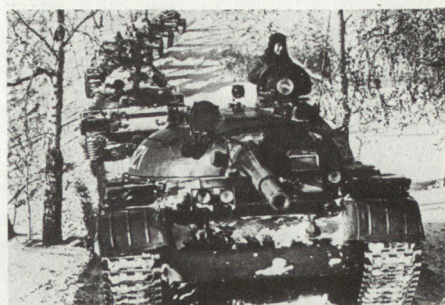
Eine Kolonne T-62-Kampfpanzer.

Es wäre falsch, Vigors Untersuchungen allein am «Szenario für den perfekten Blitzkrieg» zu messen, in dem die Sowjets tatsächlich der NATO in kürzester Zeit eine vernichtende Niederlage zufügen. Jeder militärische Kenner der östlichen Bedrohung wird bei diesem Szenario nämlich Vorbehalte anmelden. Vigor will mit ihm bloss eine mögliche Realisierung der in seiner vorangehenden Arbeit untersuchten sowjetischen Denkweise aufzeigen.