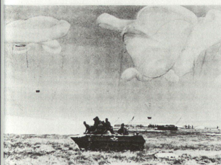
Landung von BMD-Luftlandpanzer auf Spezialpalette mittels Fallschirmen und Bremsraketen.

Totale strategische Überraschung ist eine Illusion, sie erzielen zu wollen praktisch unmöglich. Wir behaupten, im Westen in der Lage zu sein, eine totale Überraschung verhindern zu können. Das stimmt, andererseits gibt sich die NATO nach Vigors Ansicht der Selbsttäuschung hin, wenn sie glaubt, totale Überraschung sei für den Erfolg des WAPA notwendig. Totale Niederlage kann auch mittels eines reduzierten Grades strategischer Überraschung erzielt werden, falls diese zeitverzugs- und rücksichtslos mit grösstmöglicher militärischer Wucht ausgebeutet wird. Es genügt zum Beispiel, die wichtigsten politischen Entscheidungsträger im Westen zu täuschen und zu überraschen. Während Zeiten politischer Entspannung, reger Friedens- und Abrüstungsgespräche und scheinbarem Entgegenkommen wird mit allen Mitteln der psychologischen Kriegführung die Abneigung der Politiker vor drastischen und unbeliebten Anordnungen,