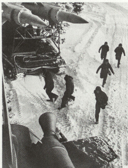
Alarm bei einem Flab-Lenkwaffen-System SA-4 GANEF.

Am erfolgreichsten wird die Überraschung dann sein, wenn es gelingt, den Gegner zu veranlassen, bei Kriegsbeginn seine Truppen falsch zu dislozieren. Vom Nachteil eines falschen Aufmarsches wird er sich nicht erholen können.