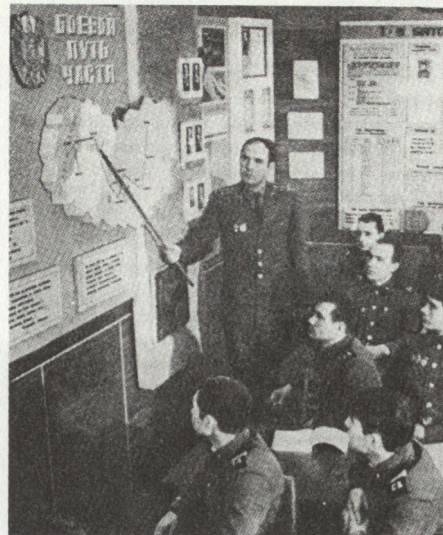
Bild 1. Neben militärischer immer wieder politische Ausbildung.

Sie wird als ein ununterbrochener Prozess zur Heranbildung hoher politischer, moralischer und psychologischer Eigenschaften der Angehörigen der Streitkräfte angesehen. Als «Be-