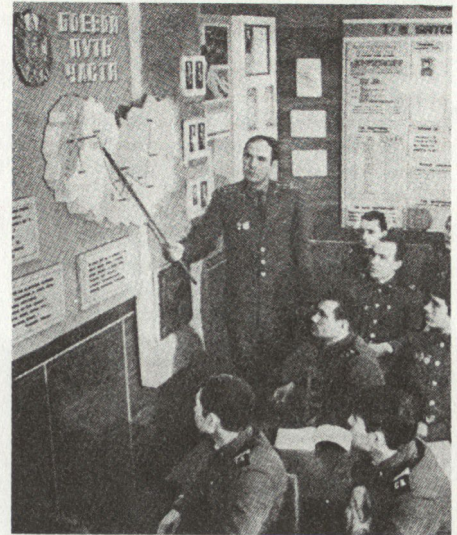
Bild 1. Neben militärischer immer wieder politische Ausbildung.

Sie wird als ein ununterbrochener Prozess zur Heranbildung hoher politischer, moralischer und psychologischer Eigenschaften der Angehörigen der Streitkräfte angesehen. Als «Be-