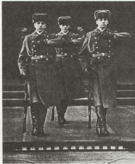
Bild 3. Eiserne Disziplin überall, auch bei der Wachablösung am Lenin-Mausoleum.

Die sowjetische Führung ist fest davon überzeugt, dass die Quelle ihres Sieges bei der Oktoberrevolution die