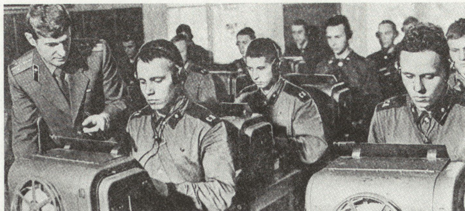
Bild 9. Die Ausbildung verlangt bei allen Waffengattungen mehr Leistung in kürzerer Zeit; auch hier gibt es Schwierigkeiten.