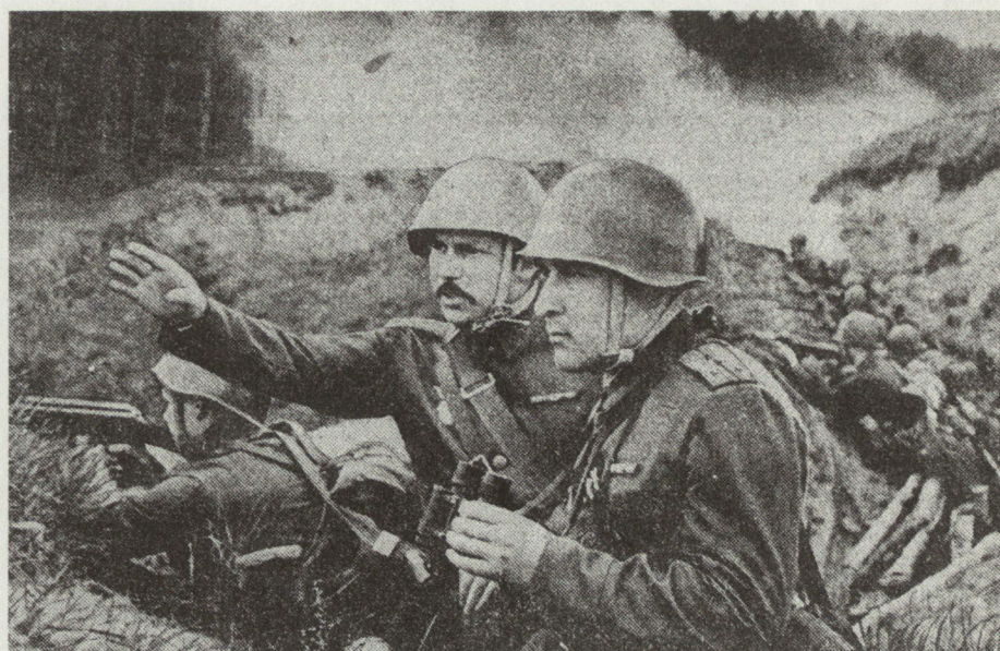
Bild 8. Die unablässige Forderung nach Initiative lässt den Schluss zu, dass die sowjetische Führung damit nicht zufrieden ist.