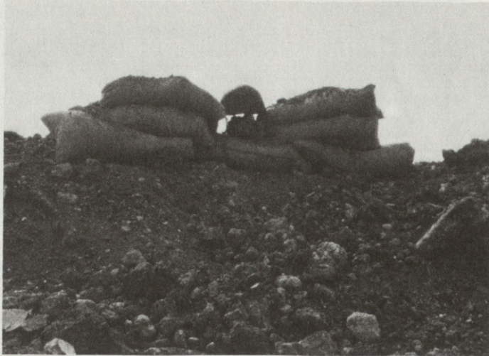
Bild 4. Scheinstellung einer israelischen Panzerposition nordöstlich des Flugplatzes von Beirut. Der Helm soll, abseits von den Feuerpodesten der Panzer, das palästinensische Feuer anziehen. Beachtenswert die mehrere Meter hohe Aufschüttung: Wie im Jom-Kippur-Krieg führen die Israeli Bulldozer-Panzer mit, die für die Kampfpanzer Deckungen aufschütten.