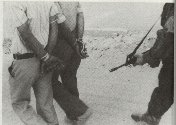
Bild 5. Abführung zweier Gefangener; man beachte die Zivilkleider. Im Gegensatz zu den Nahost-Kriegen von 1956 (Sinai-Feldzug), 1967 (Sechstage-Krieg) und 1973 (Jom-Kippur-Krieg) stellt die Zivilbevölkerung im Krieg von 1982 ein zentrales Problem dar.