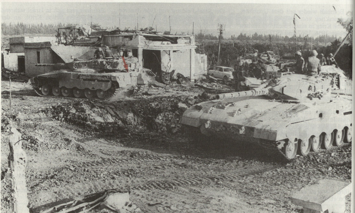
Bild 2. Israels neuer Kampfpanzer «Merkava» bestand seine Feuerprobe. Er wurde von General Israel Tal, der im Sechstagekrieg auf der Sinaihalbinsel die nördliche Kampfgruppe geführt hatte, entwickelt und erwies sich dem T-72 als überlegen. Neben der Panzerbesatzung kann der «Merkava» einen Kommandoposten oder einen Artillerie-Schiesskdt-Trupp mitführen (Einstieg siehe Pfeil).

الرقم ١١/١ التاريخ: ٢٨ أيار ١٩٨٢ الموضوع: امر القتال رقم (٤) بسم التحمير الوطني الفلسطيني القيادة العامة للقوات المسلحة قوات الفسطاط - كتيبة صيدا - ايلول تهاد: فلسطينية صيدا الاج قائد القوات المشتركة لمنطقة الجنوب تحية الثورة والصمود : الحكم تقديم الموقف في صيدا والمنطقة المحيطة بموجب امر القتال رقم (٤) : جوانب المراجعة (٥٠٠٠:١) اصدار ١٩٢٥ دمشق تهديم ميركاتور . ١ . المهمة : ١ . التصدي للعدو المحتمل ومنعه من تحقيق اهدافه في اختراق الثورة من منطقة صيدا . ٢ . التصك بكل نقاط التمرکز الحائية للقوات والدفاع عنها . ٣ . الجاهزية الدائمة لمواجهة احتمالات العدوان من قبل العدو الصهيوني والانمزال وحلفائهم . ٤ . ابقاء احتياط بقوام ( مجموعة قتالية محركة لردف محور زفتا - النابلس ) . ٢ . المهمة الارض : أ . الفطاط : تشكل المناطق الحثية في مدينة صيدا والقرى المحيطة بها مناطق مغطاة بشكل جيد من الاشجار وتوفر امكانية الاخفاء والتخوي للاليات والانفراد بشكل كامل ( تفهيم ) ما عدا مرتفع (١٨١) احداني (٣٧١٦ - ٢٨٤) ومرتفع (٦٥٣) احداني (٣٧١٤ - ٢٨٢) ومرتفع ١٢٧ احداني (٣٧١٢ - ٢٨٢) حيث تتقدم التفخية في هذه التلال عدا متناثر من بنايات قليلة . ب . الارض التكتيكية : ١ . المناطق المهمة وخاصة في صيدا - عبيدرا