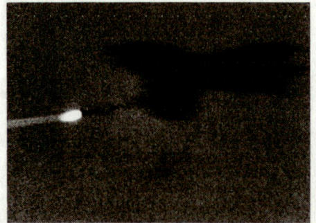
Bild 2. Die mit halbaktivem Radar ausgestattete Sparrow-Lenkfläche trifft das Ziel.