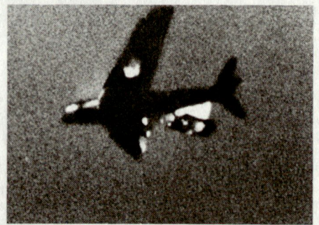
Bild 3. Das getroffene Zielflugzeug QF-86 «Sabre» stürzt brennend ab.