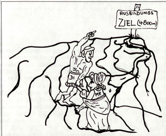
Bild 3. Verbund von Didaktik und Methodik.

«Methoden im strengen Sinne des Wortes gibt es nur als Wege zu bestimmten Zielen, und ob ein Weg richtig oder falsch, angemessen oder unangemessen ist, das richtet sich eben danach, ob er zum Ziele führt. Also: Man muss das Ziel kennen, um über den Weg entscheiden zu können ... Methoden können nur entworfen und bewertet werden, wenn didaktische Vorentscheidungen gefallen sind, und umgekehrt: Jeder methodische Entwurf schliesst immer schon – bewusst oder unbewusst – didaktische Voraussetzungen ein 2 .»